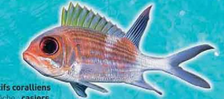
Cardinal Holocentrus ascensionis Famille : Holocentridae Lieu de vie : récifs coralliens Technique de pêche : casiers Saison de pêche : toute l'année Taille courante : 15-25 cm Réglementation : taille supérieure à 10 cm