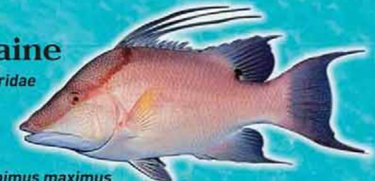
Capitaine Lachnolaimus maximus Famille : Labridae Lieu de vie : tombants coralliens et plateaux à gorgones Technique de pêche : casiers, pêche sous-marine Saison de pêche : toute l'année Taille courante : 40 cm Réglementation : taille supérieure à 10 cm