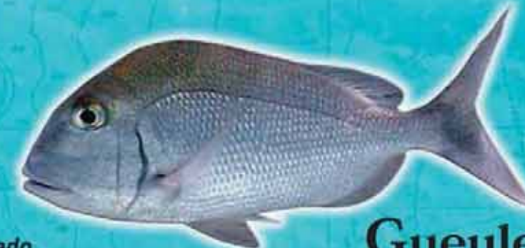
Gueule ferrée Calamus bajonado Lieu de vie : récifs coralliens et plateaux à gorgones Technique de pêche : casiers, filets Saison de pêche : toute l'année Taille courante : 30 cm Réglementation : taille supérieure à 10 cm