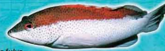
Tanche fine Cephalopholis fulva Lieu de vie : récifs coralliens Technique de pêche : casiers, lignes Saison de pêche : toute l'année Taille courante : 20 cm Réglementation : taille supérieure à 10 cm