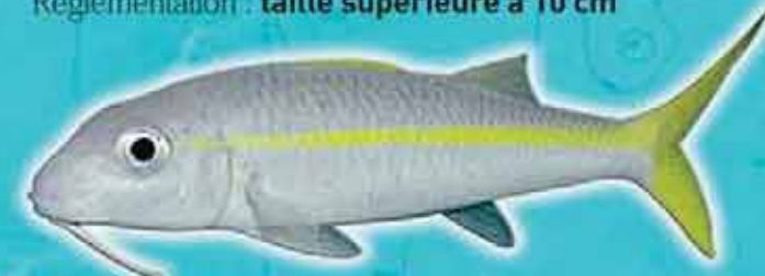
Barbarin Mulloidichthys martinicus Lieu de vie : récifs et sable Taille courante : 25 cm Technique de pêche : casiers, lignes Saison de pêche : toute l'année Taille courante : 25 cm Réglementation : taille supérieure à 10 cm