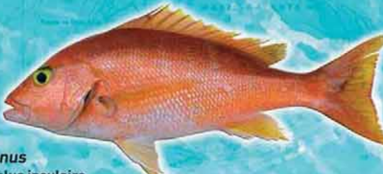
Vivaneau Lutjanus vivanus Lieu de vie : talus insulaire, en profondeur (100-300 m) Technique de pêche : filets, palangre, ligne Saison de pêche : toute l'année Taille courante : 35 cm Réglementation : taille supérieure à 10 cm