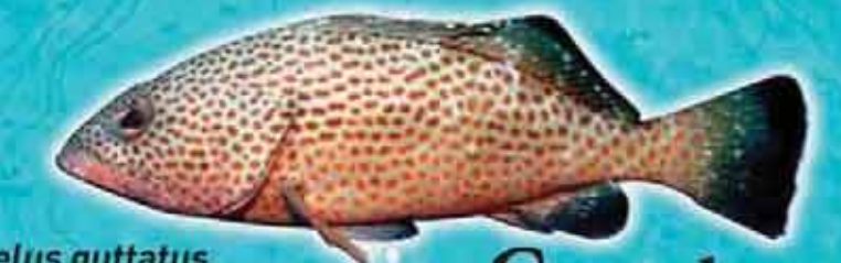
Grand-gueule Epinephelus guttatus Famille : Serranidae Lieu de vie : récifs coralliens Technique de pêche : casiers, lignes Saison de pêche : toute l'année Taille courante : 25 cm Réglementation : taille supérieure à 10 cm