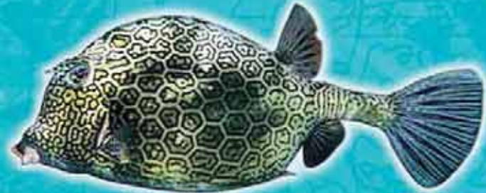
Coffre nid d'abeille Acanthostracion polygonius Lieu de vie : récifs coralliens et herbiers sous-marins Technique de pêche : casiers, filets Saison de pêche : toute l'année Taille courante : 25 cm Réglementation : taille supérieure à 10 cm