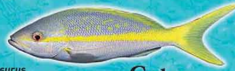
Colas Ocyurus crchysurus Lieu de vie : récifs coralliens Technique de pêche : Senne à colas, ligne Saison de pêche : abondant de juin à août Taille courante : 30 cm Réglementation : taille supérieure à 10 cm