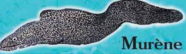
Murène tachetée ou Congre noir Gymnothorax moringa Lieu de vie : récifs coralliens Technique de pêche : casiers, lignes Saison de pêche : toute l'année Taille courante : 80 cm