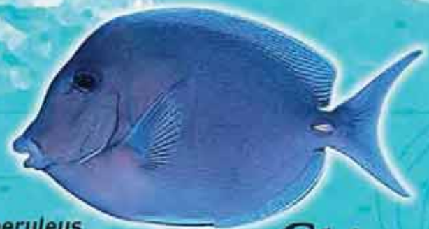
Chirurgien bleu Acanthurus coeruleus Lieu de vie : récifs coralliens Technique de pêche : casiers Saison de pêche : toute l'année Taille courante : 15 cm Réglementation : taille supérieure à 10 cm