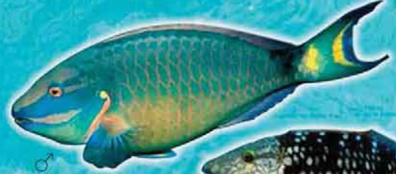
Chat rose et Chat vert Sparisoma viride Lieu de vie : récifs coralliens Technique de pêche : casiers, filets Saison de pêche : toute l'année Taille courante : 20 cm pour la phase initiale et 25 cm pour la phase terminale Réglementation : taille supérieure à 10 cm