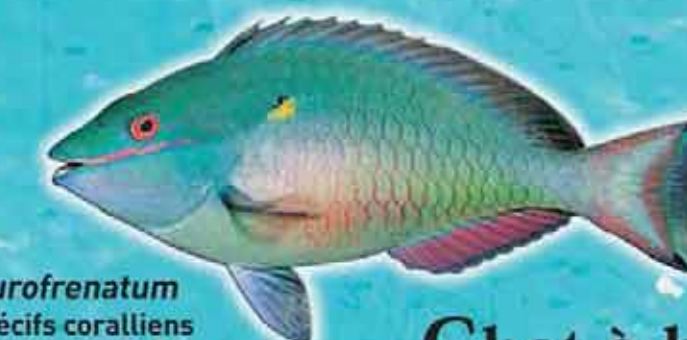
Chat à bride Sparisoma aurofrenatum Lieu de vie : récifs coralliens Technique de pêche : casiers, filets Saison de pêche : toute l'année Taille courante : 15 cm pour la phase initiale et 250 cm pour la phase terminale Réglementation : taille supérieure à 10 cm