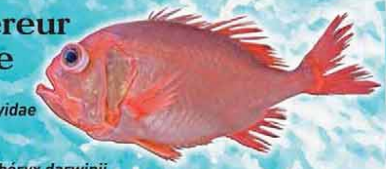
Empereur créole Géphyrobéryx darwini Famille : Trachichthyidae Lieu de vie : Fonds rocheux profonds (100 à 500 m) Technique de pêche : filets profonds Saison de pêche : toute l'année Taille courante : 40 cm