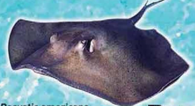
Raie fouet ou pastenague Dasyatis americana Lieu de vie : fonds sableux Technique de pêche : filets Saison de pêche : toute l'année Taille courante : 1 m d'envergure