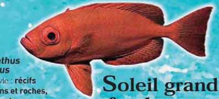
Soleil grand fond Priacanthus arenatus Famille : Priacanthidae Lieu de vie : récifs coralliens et roches, en profondeur Technique de pêche : casiers, ligne Saison de pêche : toute l'année Taille courante : 20 cm Réglementation : taille supérieure à 10 cm