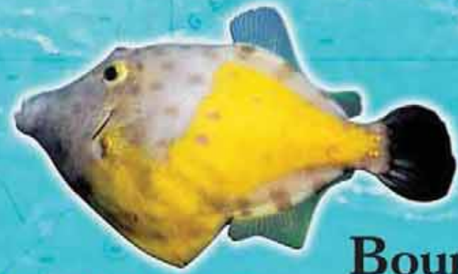
Bourse cabrit Cantherhines macrocerus Lieu de vie : récifs coralliens Technique de pêche : casiers Saison de pêche : toute l'année Taille courante : 25 cm Réglementation : taille supérieure à 10 cm