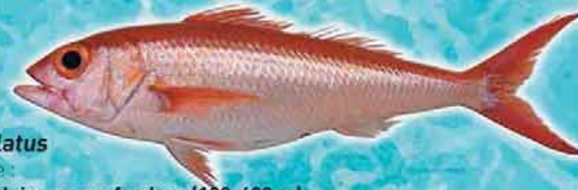
Œil de bœuf Etelis oculatus Lieu de vie : talus insulaire, en profondeur (100-400 m) Technique de pêche : filets profonds, palangres Saison de pêche : toute l'année Taille courante : 60 cm Réglementation : taille supérieure à 42 cm