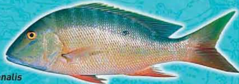
Pagre rose ou Pagre vivaneau Lutjanus analis Lieu de vie : récifs coralliens et plateaux à gorgones Technique de pêche : casiers, filets, lignes Saison de pêche : toute l'année Taille courante : 50 cm